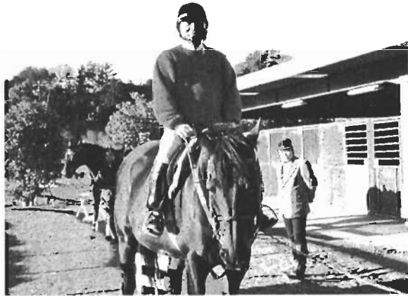
浜松の運動公園では乗馬ができました。

三分の一を要望している。予定は1 5年前半に都市計画決定。手続の中 で地元説明会をする。補助要望。1 6年度に工事着手。20年度、市政 60周年度に完成予定。