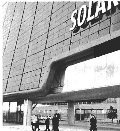
ソーラー・自然エネルギーの視察（岐阜市）。100mくらいの建物の壁全てがソーラーシステム（三洋電機）

A 答え…親子で相談して申し込むわけだが、今後の課題として子供の希望があっても家庭の事情で申し込まなかった家庭については検討する必要がある。