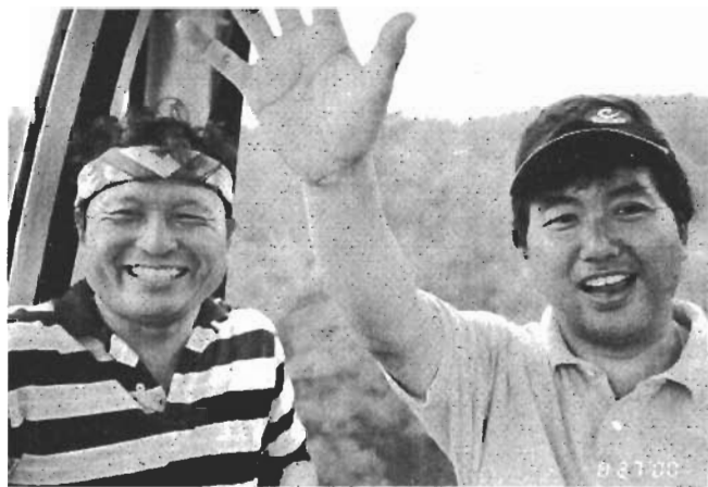
夏のキャンプ。楽しいことは続けたい。

マイナス分は国や県からの補助金や市債(借金)などでまかなっている状態(1市5町の自主財源は五十八億円に対し執行予算は八十八億円(平成十三年度)です。今後このまま国から財源の応援が来続けてくれば、合併などしなくても特に問題はないでしょう。しかし国はそれを『止める』という事ですから考えなければなりません。それぞれの施設の建設費や維持費等がかさみ、借りると使用料がかかります、住民税等大幅な増税を余儀なくされるでしょうし、社会福祉も減退となります。今後5年ぐらいいは良くても十年後は大変です。