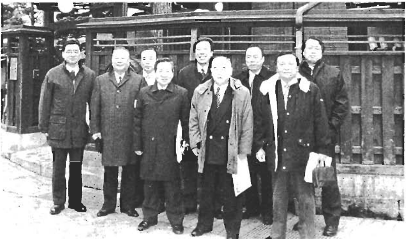
都市景観づくりで高山市へ(全派)

これは太田市の努力だけではなく、国の制度まで変えていく必要があります。国に陳情をしなければなりません。