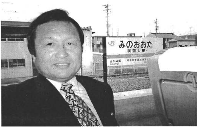
岐阜にも「太田」がありました。

Q 募集は親から学校に申込書を提出とあるが、親が子供をよく見ている家庭ほど問題はないようで、本当に指導が必要な子は、親が申込希望も出していない事が多いのではないか？